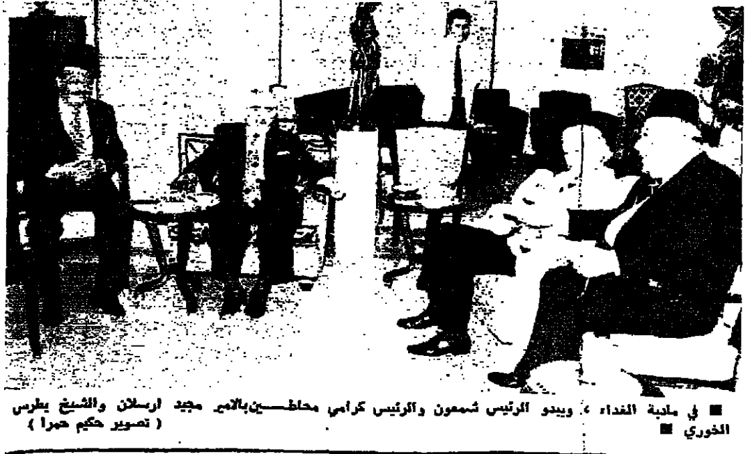
في مدينة الغداه ، ويبدو الرئيس شمعون والرئيس كراي محاطين بالاحر مجد ارسال والشهيد بطرس الخوري

أحالت لجنة الاطفال النيابية ثلاثة مشاريع الى مجلس النواب للتصديق عليها هي :